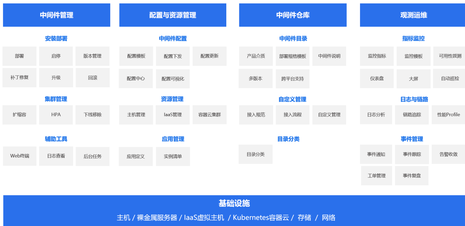
图2 - AUMP产品功能架构

AUMP在支持金蝶天燕自有的信创中间件服务供应和管理的同时，也支持第三方商业和开源中间件的接入，通过开放的管控接口和规范，实现对部署在基础设施中的各类中间件进行统一管理，帮助企业提升中间件管控效能和水平，更好的支撑业务运行和创新。